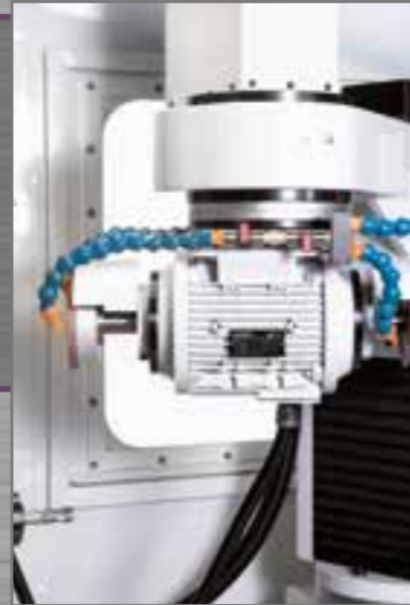
Motorized work head for O.D. grinding or circular saw sharpening.

Rotatie van de slijpschijf gecontroleerd door de CNC; als optie kan een 4-assen bestuurd machine met manuele inclinatie van de slijpschijf geleverd worden.