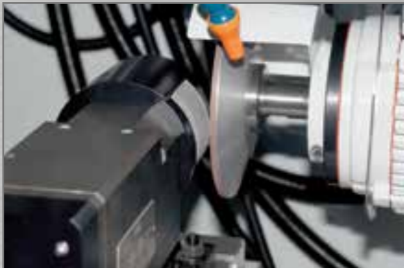
Wheel dressing device. Slijpsysteem voor de slijpschijf.

Gemotoriseerd rondslijpgereedschap voor rondslijpen en voor het slijpen van slijpschijven.