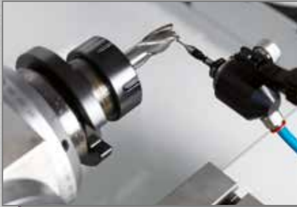
Probe to teach-in the helix. Aftaster voor het zoeken van de spiraalvorm.

Wheel head rotation controlled by CNC, as option we can supply 4 axes CNC and manual rotation of the grinding head.