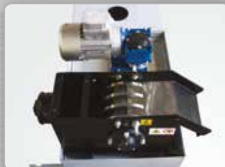
Filtre magnétique Separador magnético de partículas metálicas