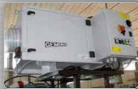
Filtre électrostatique Filtro electro-estático