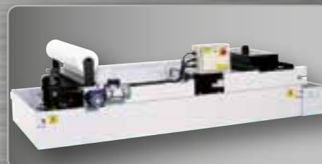
Bac d'arrosage complet de filtre à papier avec mouvement automatique Dépôt refrigerante con filtro de papel