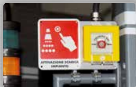
Système d'extinction d'incendie Sistema de extinción de incendio