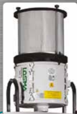
Système d'aspiration Sistema de aspiración