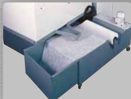
Bac d'arrosage complet de filtre à papier Dépôt de papier Depósito refrigerante con filtro de papel