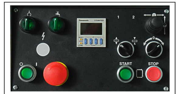
Pannello con comandi di facile interpretazione