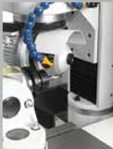
Affilatura della gola di una fresa elicoidale. Nut Schleifung einer Spiralfräser.