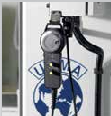
Volantino elettronico per un accurato posizionamento manuale dell'asse selezionato. Elektronisches Handrad für eine präzise Positionierung der gewählten Achse.

UT.MA s.r.l. - Via Petrarca, 16 50021 BARBERINO VAL D'ELSA (FI) Tel. +39 055 8078244 - Fax +39 055 8078498 info@utma.it - www.utma.it